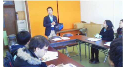
美祢市観光協会での打合せ

なお、これらのモニターツアーはコストの都合もあり、バスを使うことが多かった。しかし、今後は新型コロナ対策も考えなければならず、なおかつ観光自体も密を避けた少人数の形態が望まれている。今後の課題として、With / Afterコロナ時代における秋吉台の新たな観光を模索するため、レンタカーやレンタサイクル等を活用した、より少人数に対応可能なモニター調査に期待したい。