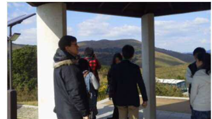
秋吉台での留学生によるモニターツアー